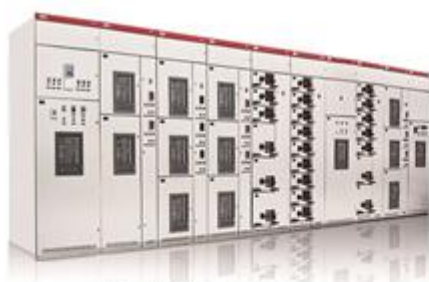
MNS低压抽出式开关柜

低压配电柜、开关柜是配电系统中的重要组成部分，根据需要可以实现低压配电线路的开断、关合、分段等功能，应用广泛。公司低配电柜有多种产品，主要产品电压涵盖0.22—1.14kV电压等级。