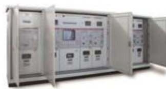
C25C中试开闭站/带开关电缆分支箱