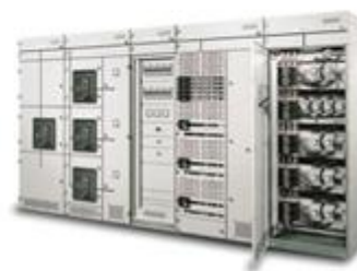
西门子授权8PT低压开关柜