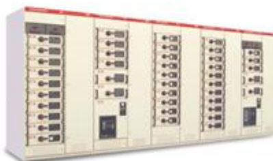
GCS低压抽出式开关柜