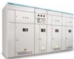
MSC型高压自动式投切无功补偿装置

电力电子产品是运用高频开关功率半导体对电力进行控制，并对电压及电流的品质进行调节。如今提高能源利用效率，普及并促进可再生能源的使用，已成为主要工业国家能源政策中必须达成的目标。这种情况下对电能而言电力电子设备市场空间巨大。公司电力电子产品主要应用于电网电力系统、地铁城铁电力贯通线及牵引变电站、城市二级变电站、风力光伏电站及其它重工业负荷。