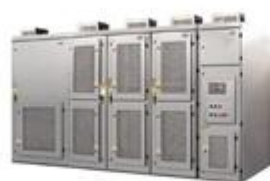
SVG高压动态无功补偿装置