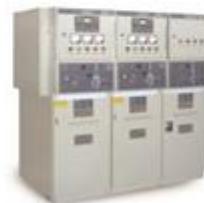
XGN15A-12小型真空开关环网柜