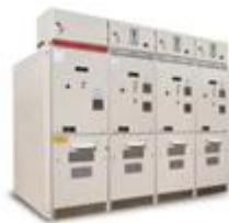
C2SR-12中试固体绝缘开关环网柜