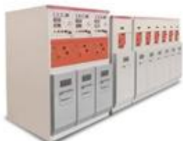
AIR-12环保气体绝缘开关环网柜