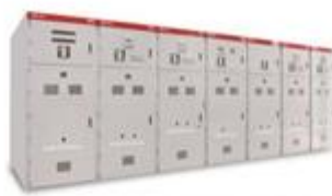
KYN61-40.5铠装移开式交流金属封闭开关柜