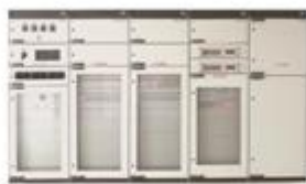
电力用直流和交流一体化电源