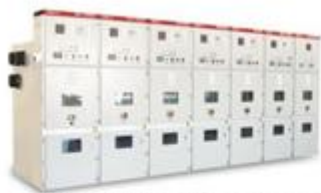
KYN28A-12铠装中置式金属封闭开关柜