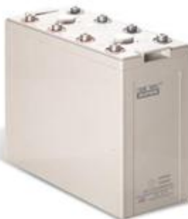
电力系统专用阀控式密封免维护铅酸蓄电池