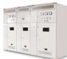
TSC型动态无功功率补偿装置